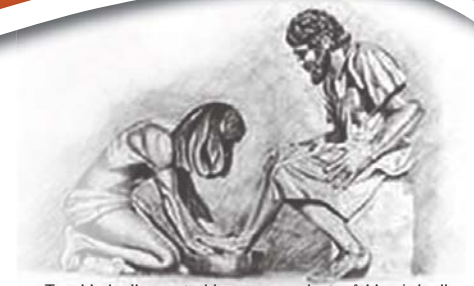
Toe Hy hulle voete klaar gewas het, sê Hy vir hulle: "Verstaan julle wat Ek vir julle gedoen het?" Uit Johannes 13: 12

www.nhk.co.za www.hervormer.co.za www.hervormer.co.za/e_Hervormer.html