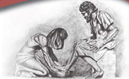
Toe Hy hulle voete klaar gewas het, sê Hy vir hulle: "Verstaan julle wat Ek vir julle gedoen het?" Uit Johannes 13: 12

Indien u nie weer die e-Hervormer wil ontvang nie, klik op www.hervormer.co.za/cancel.html