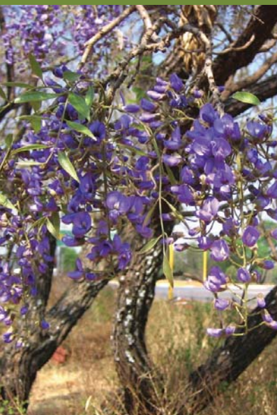
Die pragtige vanwykshout