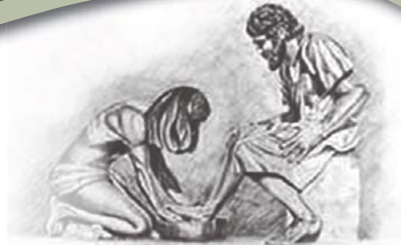
Toe Hy hulle voete klaar gewas het, sê Hy vir hulle: "Verstaan julle wat Ek vir julle gedoen het?" Uit Johannes 13: 12

Webblad van die Hervormde Kerk www.nhk.co.za Die Hervormer www.hervormer.co.za e-Hervormer www.hervormer.co.za/e_Hervormer.html