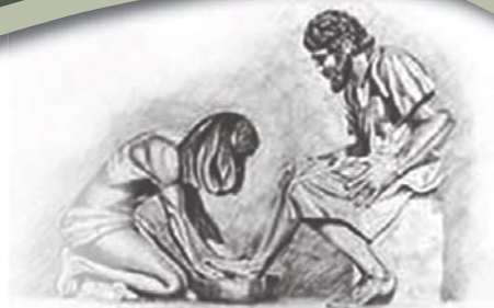
Toe Hy hulle voete klaar gewas het, sê Hy vir hulle: "Verstaan julle wat Ek vir julle gedoen het?" Uit Johannes 13: 12

www.nhk.co.za www.hervormer.co.za www.hervormer.co.za/e_Hervormer.html