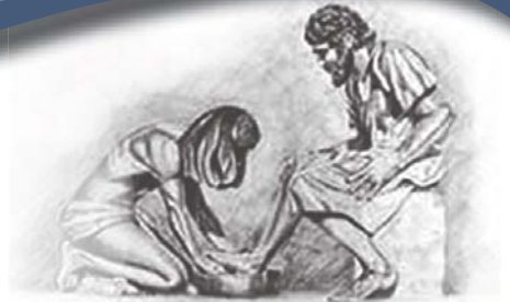
Toe Hy hulle voete klaar gewas het, sê Hy vir hulle: "Verstaan julle wat Ek vir julle gedoen het?" Uit Johannes 13: 12