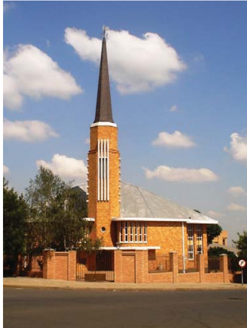
Die kerkgebou van Gemeente Ermelo