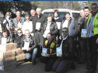
Sommige lede van Gemeente Randburg se motorfietsbediening

word, is die Bybels aangekoop. Dit is die Lees en Leer Bybel vir kinders in die ouderdomsgroep 7 tot 12 jaar, en is 'n produk van die Bybelgenootskap van Suid-Afrika. Op Sondag 13 September is Bybels ter waarde van R15 000 na Primrose-Oos geneem. Die aflewering en oorhandiging is gedoen deur die entoesiastiese lede van Gemeente Randburg se motorfietsbediening. Die nuus van die besoek het egter uitgelek en groot was die verrassing toe die 14 Randburg-motorfiets op die kerkterrein van Primrose-Oos ontvang is deur 'n motorfietsklub van die Oos-Rand met die naam Bad Boys . Ds CJ van Wyk het in sy kort toespraak na hulle verwys as die rîrige bikers (dis nou die ouens met die baie badges op hul baadjies). Vir die volgepakte kerkgebou was dit waarskynlik iets nuuts om mense met buitengewone kerklere in die erediens te hê. Waarskynlik ook 'n nuwe ervaring vir ds Larry van der Walt, wat die erediens gelei het. Randburg wens Primrose en Primrose-Oos alle sukses toe met die Saadjie-projek. As u graag meer oor die Saadjie-projek te wete wil kom en dalk 'n bydrae wil lewer, kontak Annelie Swanepoel van Primrose-Oos by 082 870 7795.