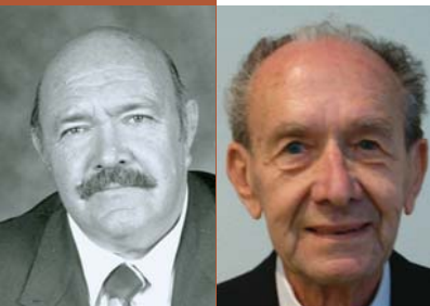
Ds At Mc Donald