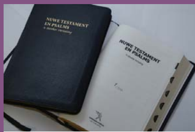
Nuwe Testament en Psalms