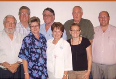
Komitee vir Bejaardesorg