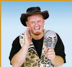
Thys die Bosveldklong