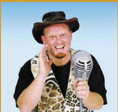
Thys die Bosveldklong