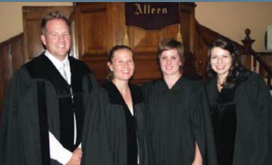
4 nuwe proponente

In die lig van die dagvaarding teen die Kerk en die talle voortgaande dreigemente van regsaksies teen die Kerk en lidmate van die Kerk, het die Kommissie dit aan die Bemiddelingskomitee opgedra om te verseker dat die komitee van die steedsHervormers voor of op 15 Maart 2012 skriftelik bevestig dat al hierdie regsaksies en handeling wat daarmee verband hou, teruggetrek is en dat alle sodanige optrede beëindig word.