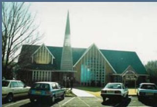
Gemeente Drie Riviere se kerkgebou