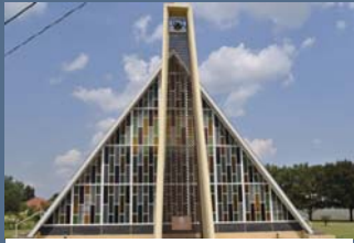
Gemeente Morgenzon se kerkgebou