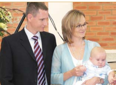
Die eerste dopeling van Gemeente Midstream