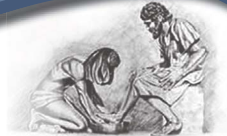
Toe Hy hulle voete klaar gewas het, sê Hy vir hulle: "Verstaan julle wat Ek vir julle gedoen het?" Uit Johannes 13: 12

Webblad van die Hervormde Kerk www.nhk.co.za Die Hervormer www.hervormer.co.za e-Hervormer www.hervormer.co.za/e-hervormer.html