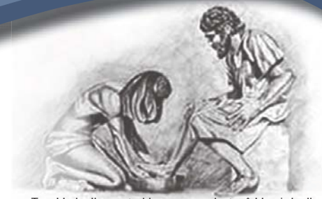
Toe Hy hulle voete klaar gewas het, sê Hy vir hulle: "Verstaan julle wat Ek vir julle gedoen het?" Uit Johannes 13: 12

Webblad van die Hervormde Kerk www.nhk.co.za Die Hervormer www.hervormer.co.za e-Hervormer www.hervormer.co.za/e-hervormer.html