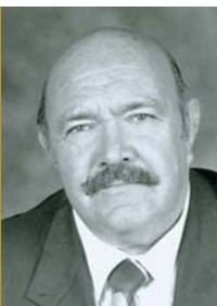
Ds At MacDonald