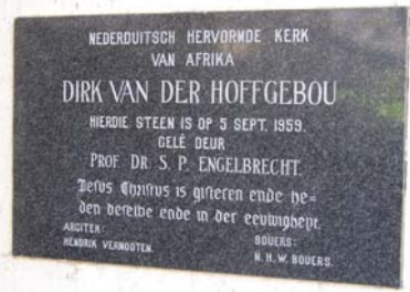
Dirk van der Hoffgebou se hoeksteen

Die gebou is vernoem na die eerste predikant in Transvaal, die naamgewer van die stad Pretoria, 'n figuur wat baanbrekerswerk verrig het. By die geleentheid op Saterdag 5 September was daar benewens kerklike figure ook hoogwaardigheidsbekleërs soos die Nederlandse ambassadeur, mnr Van der Berg, en adv John Vorster, die destydse Adjunkminister van Onderwys.