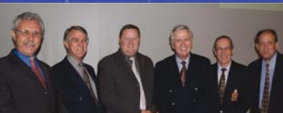
Die huidige Moderamen en predikantslede van die Kommissie van die AKV