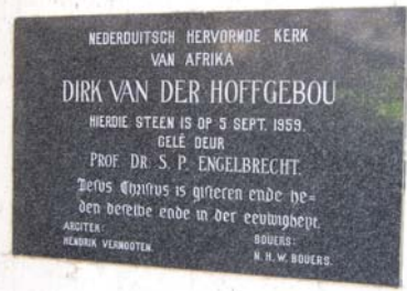
Dirk van der Hoffgebou se hoeksteen