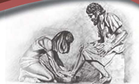
Toe Hy hulle voete klaar gewas het, sê Hy vir hulle: "Verstaan julle wat Ek vir julle gedoen het?" Uit Johannes 13: 12

Indien u nie weer die e-Hervormer wil ontvang nie, klik op www.hervormer.co.za/cancel.html