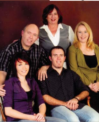
Die gesin Mc Donald