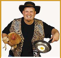
Thys die Bosveldklong